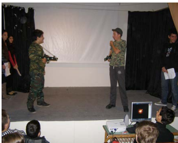
"Οι πιτσιρίκοι" εορτασμός 28ης Οκτωβρίου