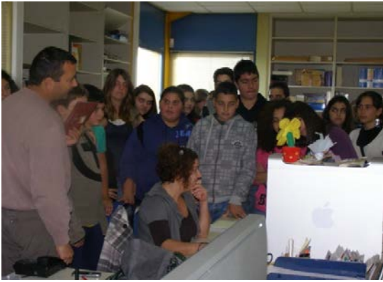
επίσκεψη στην Γραφοτεχνική