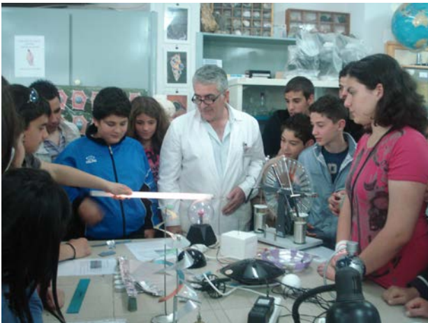
εκπαιδευτική επίσκεψη στο Ε.Κ.Φ.Ε