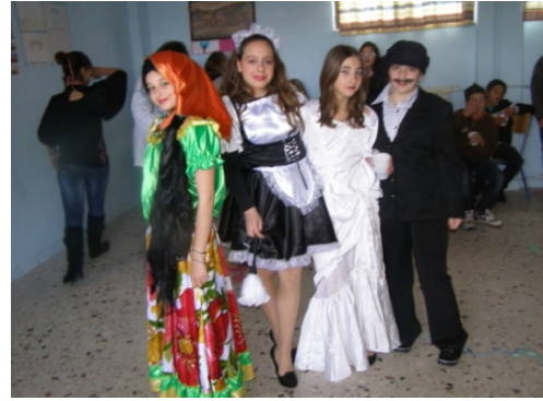
Απόκριες στο σχολείο