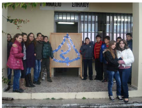
«Κάνε μια ευχή» Χριστούγεννα 2011