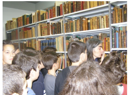
Επίσκεψη στη βιβλιοθήκη του Πανεπιστημίου