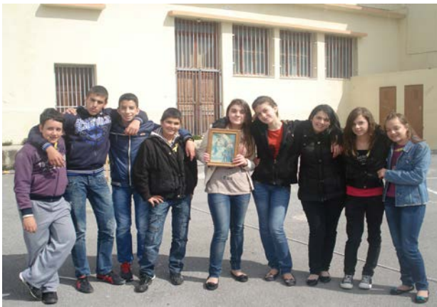
Οι νικητές στο κυνήγι του χαμένου θησαυρού