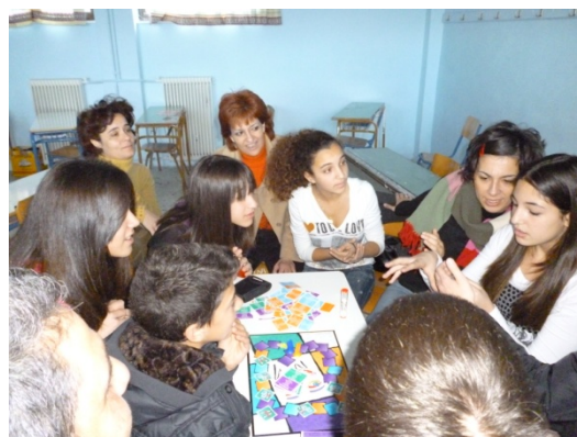
Καθηγητές-μαθητές σημειώσατε x