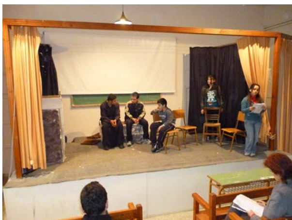
Πρόβα από το Χριστουγεννιάτικο θεατρικό